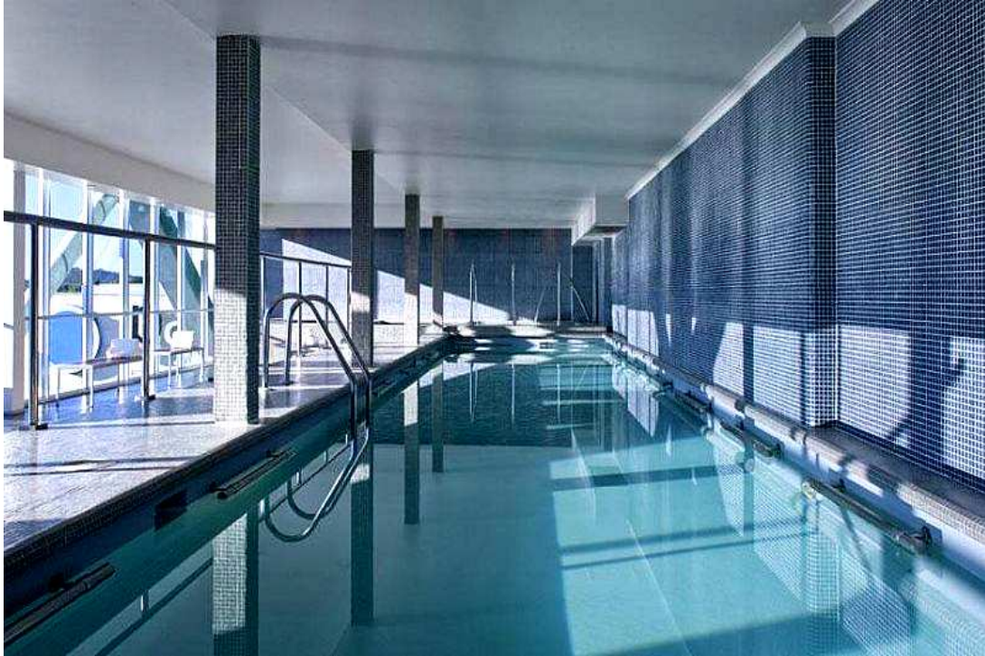
HOTEL SHERATON LOS ANGELES: