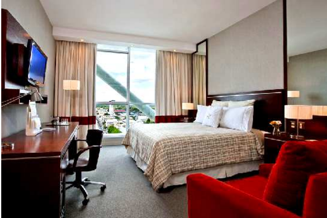
HOTEL SHERATON LOS ANGELES: